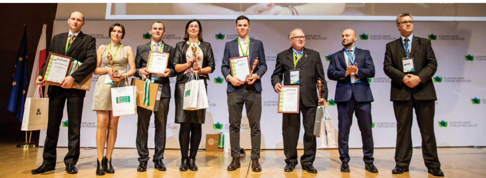
Laureaci konkursu „Innowacyjny Rolnik”